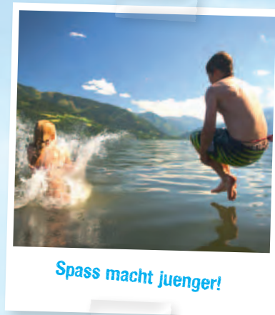
Spass macht juenger!