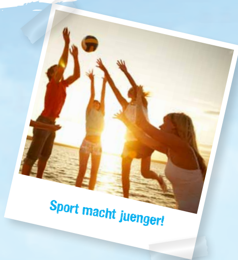
Sport macht juenger!

Gefragt sind coole, witzige, kreative, frische Freizeitfotos!