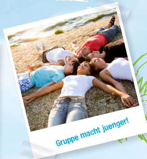
Gruppe macht juenger!